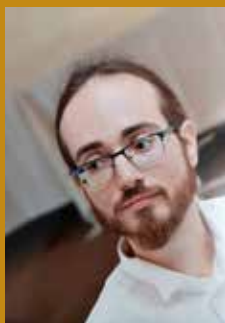
Πάυλος Μεταξάς βιόλα